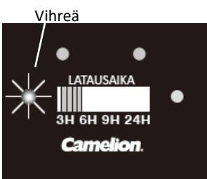
Kuva 3: Ylläpitolataustila