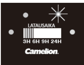
Kuva 1: Nopean latauksen tila