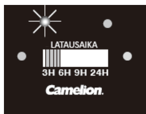
Kuva 2: Nopean latauksen tila (9V akku)